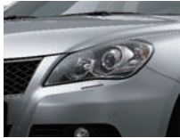
Premium Silver Metallic (ZNC)