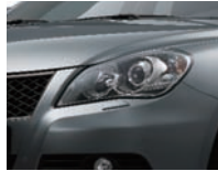
Mineral Gray Metallic (ZMW)