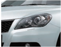
Snow White Pearl Metallic (ZMT)