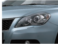
Glacier Blue Metallic (ZPM) nur 4x4