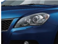
Prussian Blue Pearl Metallic (ZMZ) nur 4x4