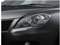
Super Black Pearl Metallic (ZMV)