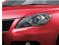
Fervent Red (ZNB)