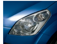
Kashmir Blue Pearl (ZCG)