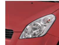
Sunlight Copper Metallic (ZFS)