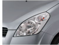
Galactic Gray Metallic (ZCD)