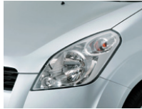
Silky Silver Metallic (ZCC)