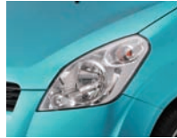
Splash Turquoise Blue Metallic (ZKC)