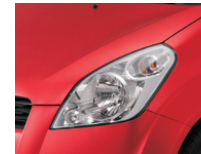
Bright Red (ZCF)