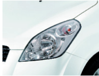
Pearl White (26U) / ZNL