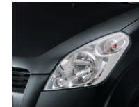
Cosmic Black Metallic (ZCE)