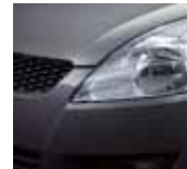
Mineral Gray Metallic (ZMW)