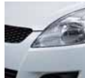
Cool White Pearl (ZNL)