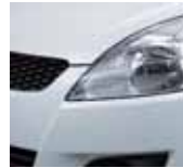
Snow White Pearl (ZMT)