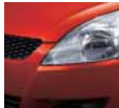
Sunlight Copper Pearl Metallic 2 (ZFM)