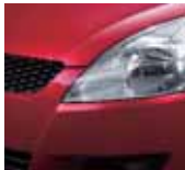
Ablaze Red Pearl 2 (ZRJ)