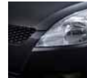
Super Black Pearl (ZMV)