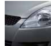
Galactic Gray Metallic (ZCD)