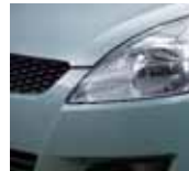
Smoky Green Metallic 2 (ZRL)