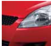
Bright Red 5 (ZCF)