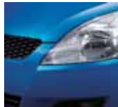
Kashmir Blue Pearl Metallic 2 (ZCG)