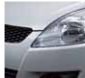
Star Silver Metallic (ZMU)