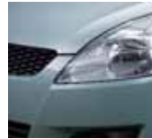
Smoky Green Metallic (ZRM)